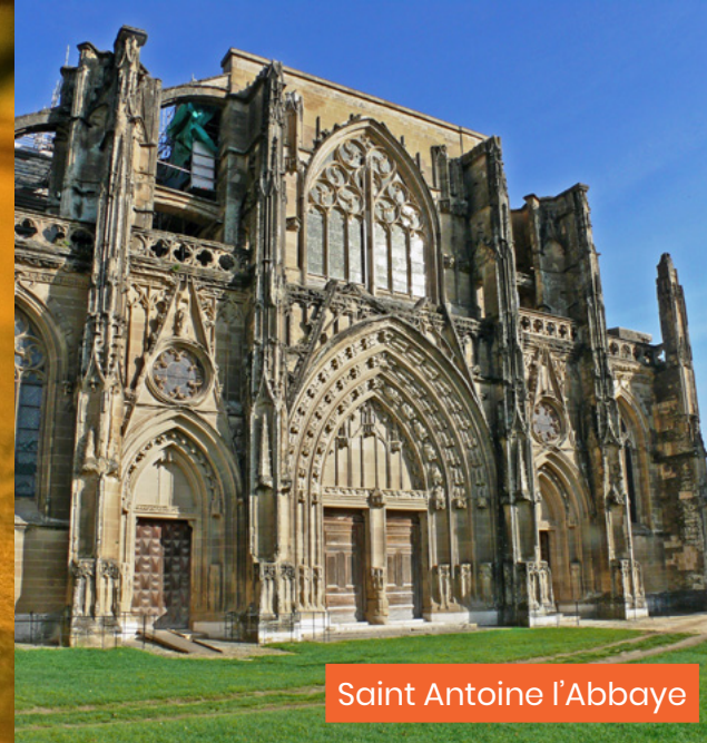
Saint Antoine l'Abbaye