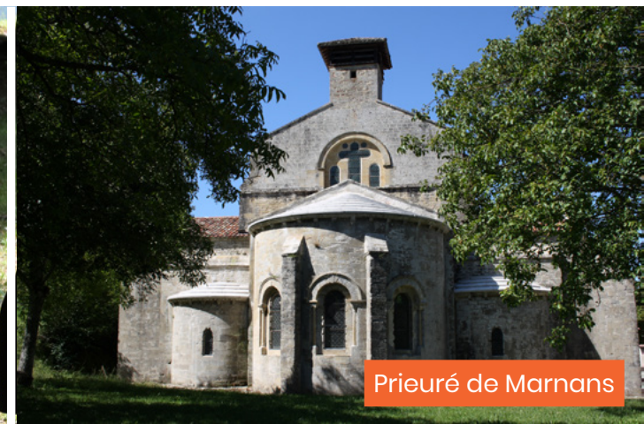
Prieuré de Marnans