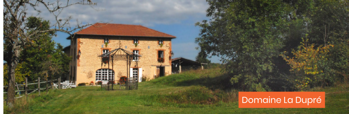
Domaine La Dupré